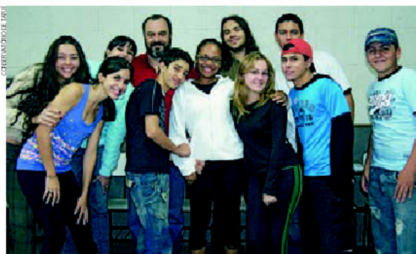
Grupo de jovens atores que participa do projeto Conexões no Conservatório de Tatuí