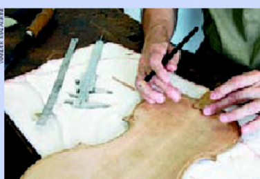
Construção de instrumentos exige destreza e sensibilidade

Pela primeira vez no País, luthiers (profissionais que fabricam instrumentos de cordas com caixa de ressonância) terão seus trabalhos avaliados e premiados. O Conservatório de Tatuí abriu inscrições ao Concurso Nacional de Luteria Enzo Bertelli , que premiará três luthiers de violinos residentes no Brasil. Quem conceber o melhor instrumento ganhará uma bolsa de estudos de três meses na Europa, enquanto o segundo colocado receberá R$ 6 mil e o terceiro, R$ 4 mil. As inscrições podem ser feitas até 31 de julho. O concurso visa a incentivar talentos da artesanaria instrumental e divulgar a luteria. O nome Enzo Bertelli homenageia um dos mais importantes luthiers da Itália, que, há 20 anos, fundou em Tatuí o curso de fabricação de instrumentos. O conservatório é uma das raríssimas escolas a oferecer o curso de luteria gratuitamente.